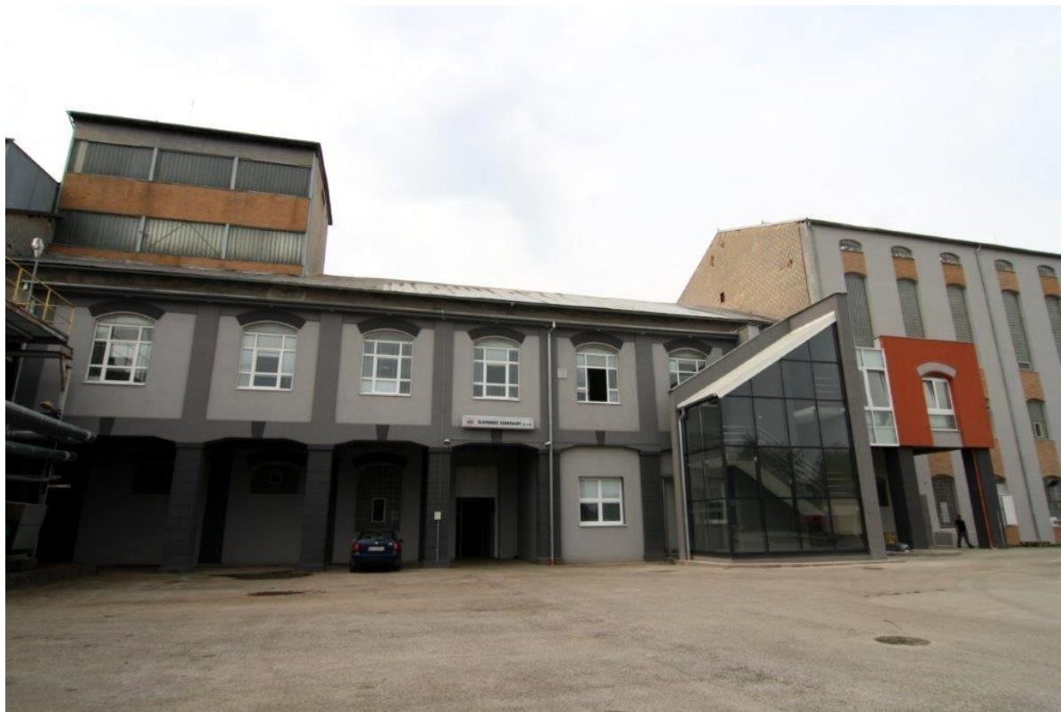
súčasnosť, cukrovar v Seredi, Slovenské cukrovary s.r.o.

Cukrovar Sered' kúpila Rakúska cukrovarnícka spoločnosť AGRANA. Cukrovar bol premenovaný na Slovenské cukrovary s.r.o Sered' a cukrovar Považský cukor a.s. Trenčianska Teplá kúpila nemecká cukrovarnícka spoločnosť Nordzucker.