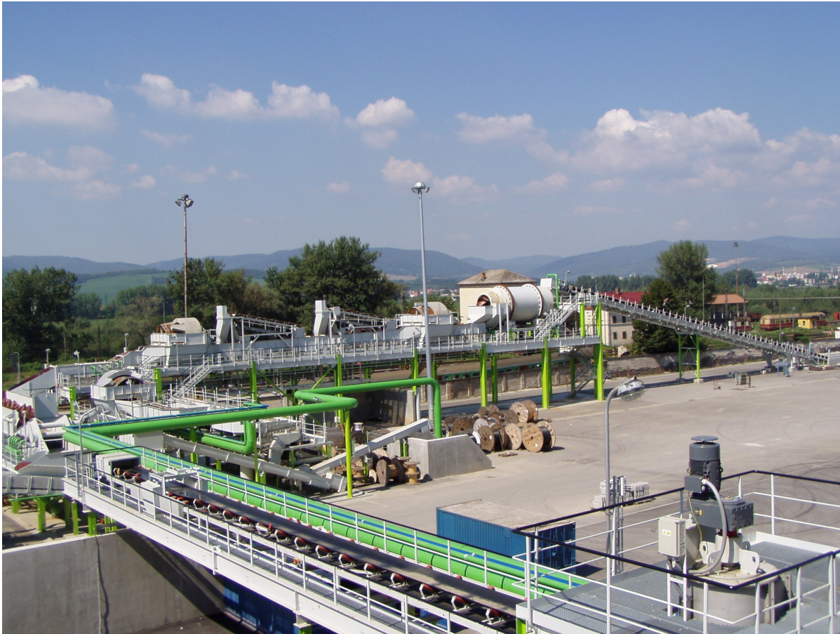
súčasnosť, cukrovar v Trenčianskej Teplej, Považský cukor, a.s.

K 30.septembru 2017 došlo v Európskej únii k zrušeniu režimu produkčných kvót a tým aj k úplnej liberalizácii trhu. Táto skutočnosť priniesla nové výzvy pre producentov cukru a pestovateľov cukrovej repy v EÚ. Vďaka nadzásobám a dlhodobo nízkym cenám vo svete ako aj v EÚ sa sektor cukor - cukrová repa ocitol v najhlbšej kríze od vzniku EÚ vôbec. V niektorých členských štátoch to viedlo k zatváraní prevádzok s dopadmi na zamestnanosť na vidieku.