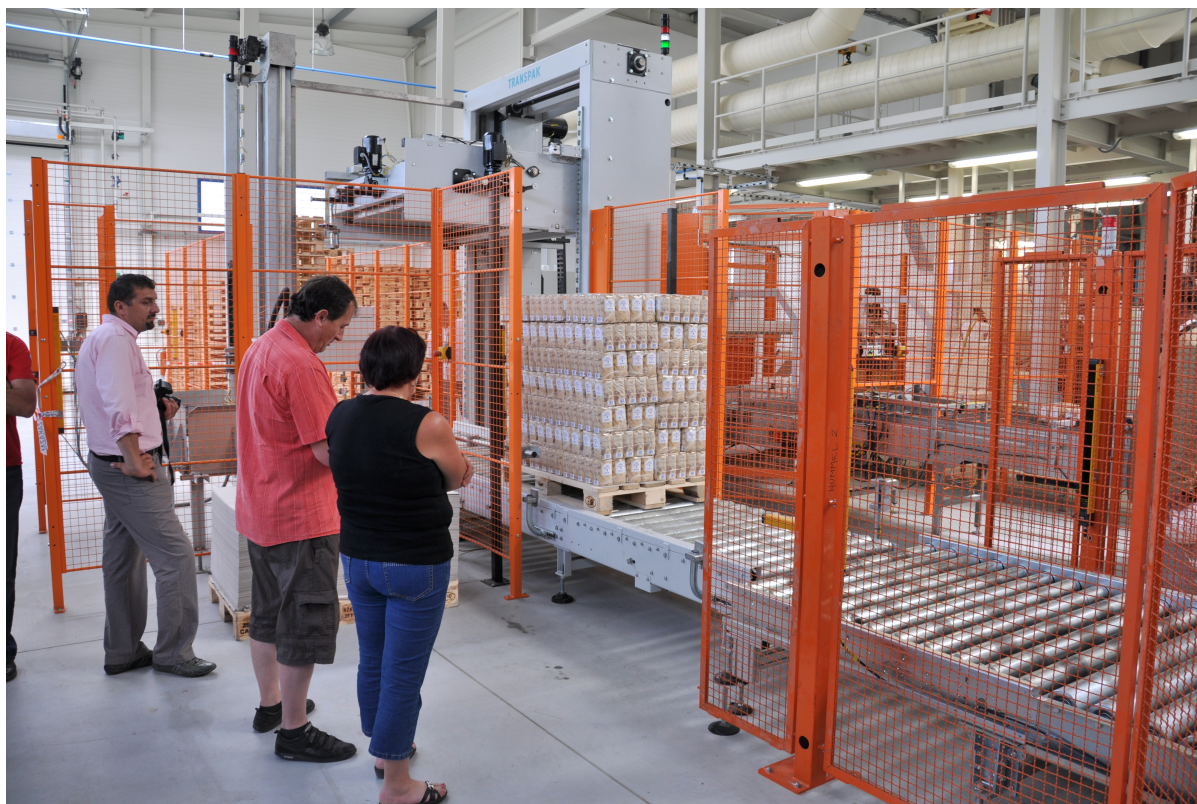
súčasnosť, cukrovar v Seredi, Slovenské cukrovary s.r.o.

Na Slovensku zostali po reforme cukrovarníckeho priemyslu EÚ, dva funkčné cukrovary. Sú nimi cukrovar Považský cukor a.s. v Trenčianskej Teplej (člen skupiny Nordzucker) a Slovenské cukrovary s.r.o. v Seredi (člen skupiny Agrana). Aj im sa krátila produkčná kvóta z rozhodnutia pestovateľov cukrovej repy a za nepochopiteľnej podpory MP SR. Výrobná kvóta postupne klesla na 112 319,5 ton. Táto kvóta však nebola postačujúca ani z hľadiska kapacitného, keďže zostávajúce cukrovary majú produkčnú kapacitu spolu na úrovni 200 000 ton cukru a nepostačovala ani z hľadiska spotreby, keďže spotreba cukru na Slovensku sa pohybuje dlhodobo na úrovni približne 180 000 ton.